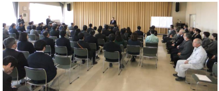
3/20(木) 転退職員紹介式

綿内小6人、川田小4人、保科小2人、若穂中6人、計18人の先生方が転退職されました。遠くは佐久市・池田町へ移動されました。若穂地区の子どもたちを親身になって指導していただきありがとうございました。また、4月2日(火)に転入職員の紹介式があり、計18人の先生方が転入されました。若穂地区へようこそ、若穂の将来を担う子どもたちをよろしくお祈いします！