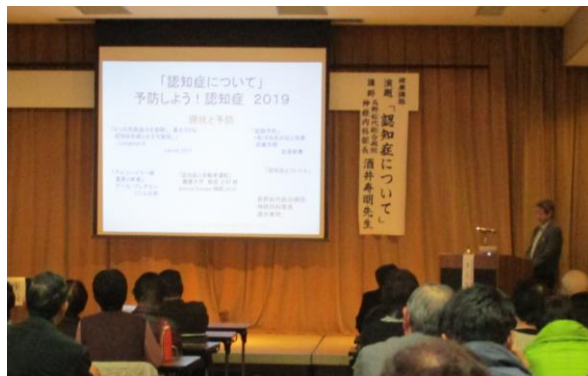
認知症の健康講話