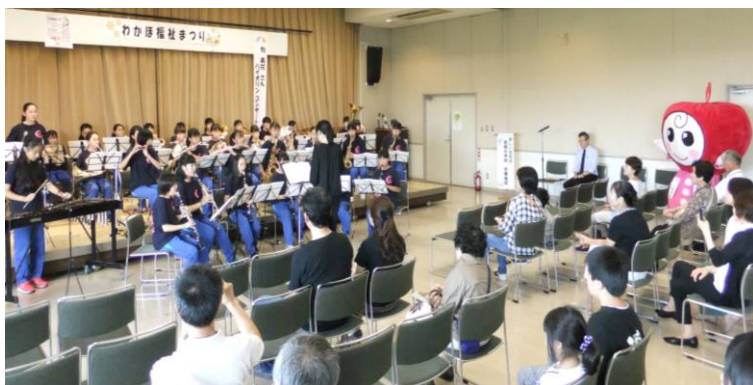
中学吹奏楽部の演奏

若穂体育館で行われた愛の助け合いバザーは各地区の皆さんからたくさんの寄贈品を提供いただき、また、参加いただいた人も多く大盛況でした。昨年のようなタイムセールはなかったのですが、バザーの後半は売れるものがなくなるほどの人気でした。ご来場いただきました皆様心から感謝いたします。さらに、魅力あるバザーをめざします。