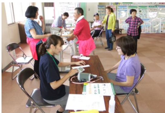
健康相談コーナー

福祉まつりの運営に関わっていただきました実行委員、関係者の皆様、大変お疲れ様でした。