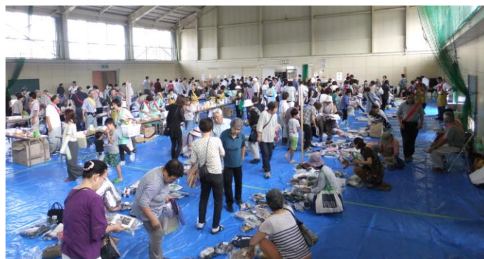
盛況のバザー会場