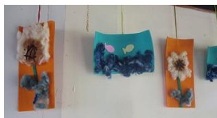
「綿」は綿内のシンボル。皆さん、機会をつくって見てくださいね。

郷土史研究会(依田修一会長)は会員を募集しています。年会費は1500円。「歴史に興味がある」「歴史が好き」なら誰でも加入OKです。一緒に楽しみましょう！